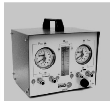
Pic.1: BFP001 (Part N° EKD.D001)